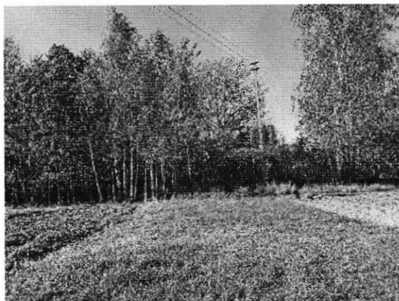
5 pav. Netvarkomos kapinės Kalvarijos savivaldybėje

Kalvarijos savivaldybės teritorijoje yra vienerios riboto laidojimo kapinės – Akmenynų kaimo senosios kapinės, esančios Mokyklos g. Akmenynų k. Šios kapinės sutvarkytos, jose yra vanduo, konteineriai atliekoms surinkti, kapinės aptvertos. Kapinių žemės sklypas įregistruotas Nekilnojamojo turto registre. Audito metu gauta informacijos, jog šiose kapinėse yra atliekami laidojimai.