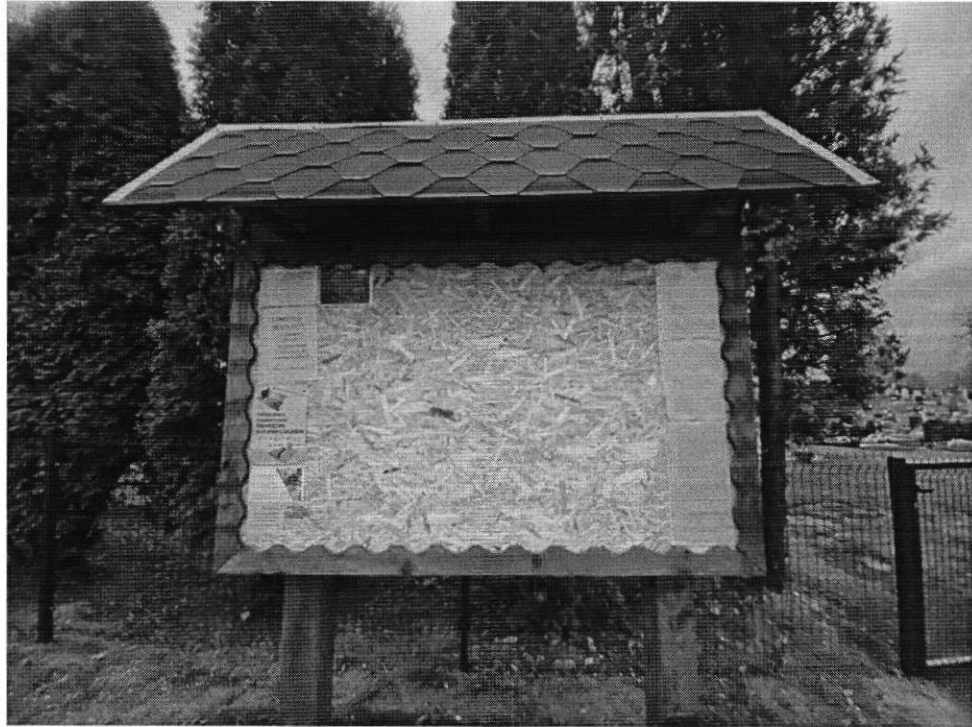
1 pav. Skelbimų lenta Sangrūdų kapinėse Mokyklos g. 28A Sangrūdų k. Kalvarijos sav.

Kalvarijos savivaldybės teritorijoje esančios veikiančios kapinės yra labai tvarkingos, prižiūrimos. Visose yra konteineriai atliekomis surinkti, kapinės aprūpintos vandeniu, aptvertos, lengvai privažiuojamos. Tačiau informacinės lentos yra tik Kalvarijos seniūnijoje veikiančiose kapinėse (2 pav.). Tuo tarpu Akmenynų, Liubavo ir Sangrūdų seniūnijų veikiančiose kapinėse informacinių lentų nėra. Audito metu buvo apžiūrima tik keletas neveikiančių kapinių. Akivaizdu, jog Kalvarijos savivaldybėje esančios neveikiančios kapinės yra tvarkomos epizodiškai, aplink išlikusius elementus nupjaunama žolė, pagal poreikį genimi medžiai, surenkamos šiukšlės. Kitose jokie tvarkymo ir priežiūros darbai neatliekami. Daugiau dėmesio ir priežiūros skiriama didesnę istorinę reikšmę turinčioms kapinėms, esančioms Kalvarijos mieste: Kalvarijos evangelikų liuteronų senosios kapinės Gėlių g., Kalvarijos evangelikų liuteronų senosios kapinės Suvalkų g., Kalvarijos Sovietinių karių kapinės Kęstučio g., Kalvarijos žydų senųjų kapinių dalis Gėlių g. (3 pav.). Šios kapinės yra reguliariai prižiūrimos, rudenį sugrėbiami lapai, šiltuoju metų laiku pjaunama žolė.