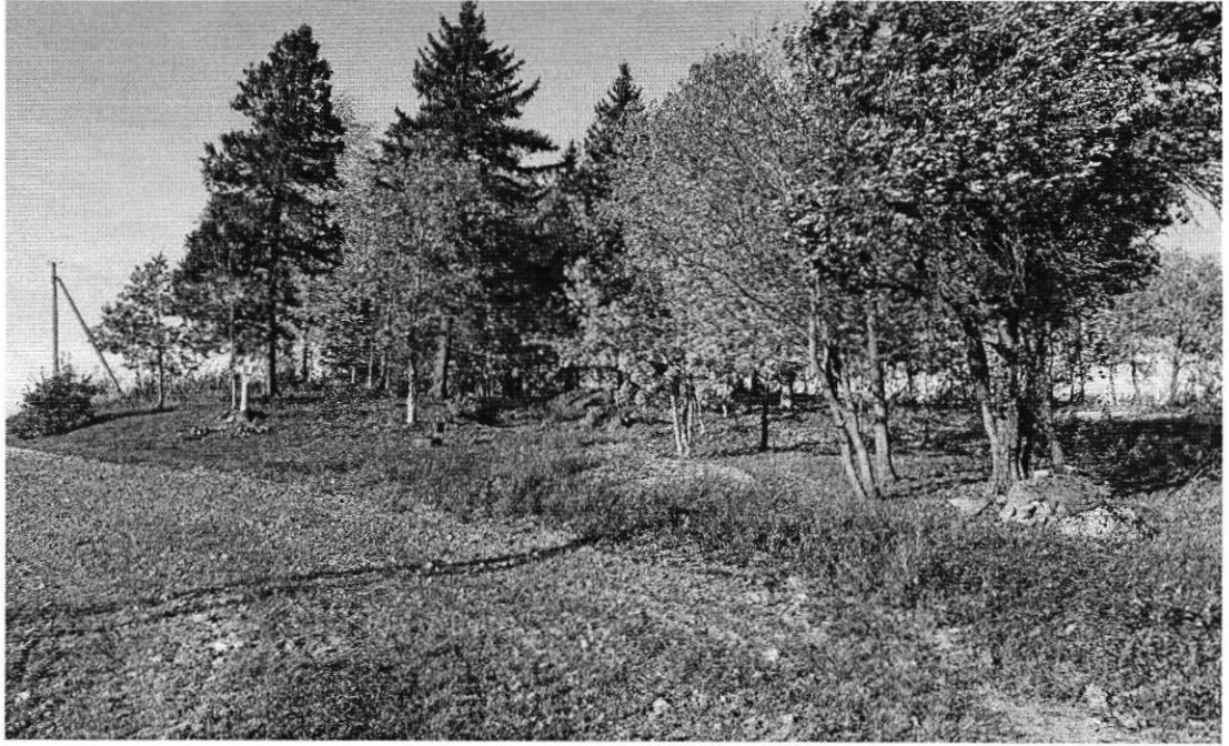
4 pav. Aistiškių k. senosios kapinės, vad. Prancūzakapinėmis, Miško g. 3A, Aistiškių k. Akmenynų sen., Kalvarijos sav.

Neveikiančių kapinių Savivaldybėje priežiūrą apsunkina tai, kad daugelio tokių kapinių buvimo vieta žinoma tik apytiksliai, nėra išlikę jokių šių objektų fragmentų. Neatlikti neveikiančių kapinių žemės sklypų kadastriniai matavimai, sklypai neįregistruoti Nekilnojamojo turto registre, aiškios sklypų ribos nežinomos. Analizuojant Kalvarijos savivaldybės tarybos 2023-03-30 sprendimą Nr. T-31 (1.5E) „Dėl Kalvarijos savivaldybės teritorijoje esančių kapinių sąrašo patvirtinimo“ matyti, jog Kalvarijos, Sangrūdės ir Liubavo seniūnijose esančių neveikiančių kapinių žemės sklypai nesuformuoti ir neįregistruoti. Akmenynų seniūnijoje neįregistruotas tik Akmenynų evangelikų liuteronų senųjų kapinių, esančių Liepų g. Akmenynų k., sklypas.